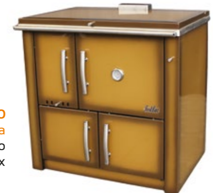
Medilar 100 Fogão a Lenha Esmaltado Castanho com mesa inox

Várias cores disponíveis Puxadores retangulares