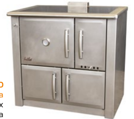
Medilar 90 Fogão a Lenha Inox Mesa vitrocerâmica