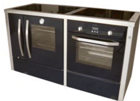
Megljar 155 Fogão a Lenha Esmaltado misto - 4B e forno elétrico Mesa vitrocerâmica Opção inox