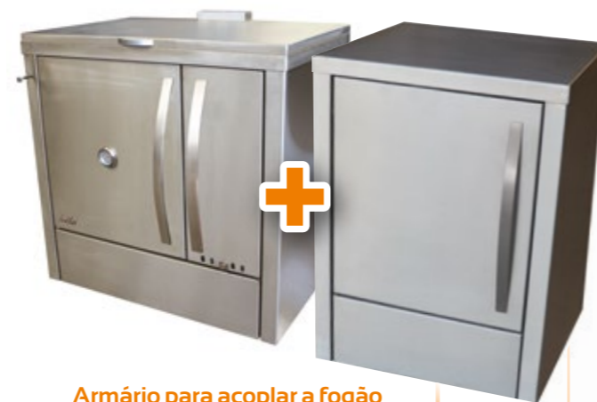
Armário para acoplar a fogão Inox, opção esmaltado L64xP61xA86