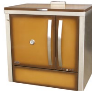
Megljar 90 Fogão a Lenha Esmaltado Castanho com lateral em inox