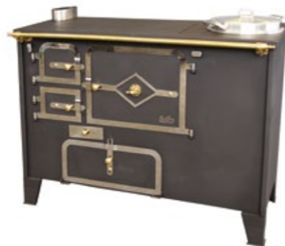
Rustilar 108 Fogão a Lenha Com panela à esquerda ou direita