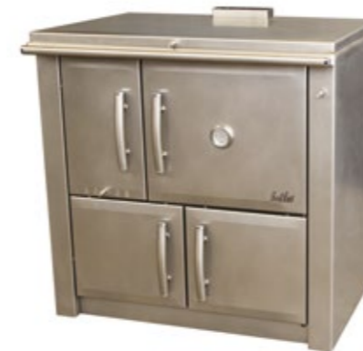
Medilar 90 Fogão a Lenha Inox com mesa inox