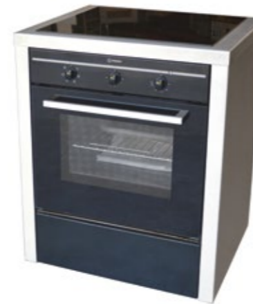
Fogão elétrico 4B Forno elétrico Esmaltado preto com lateral em inox