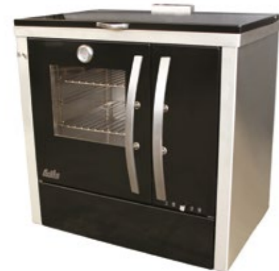
Megljar 90 Fogão a Lenha Esmaltado preto com lateral em inox e porta do forno em vidro